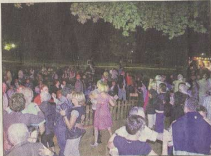
300 personnes étaient au rendez-vous à chaque soirée