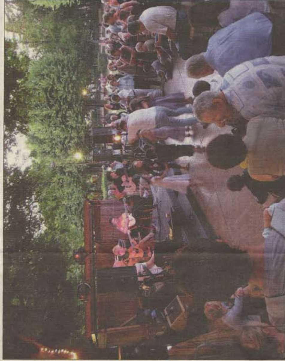
Un groupe jazz manouche a attiré plus de cinq cents personnes au parc des Bains mercredi / Photo Kim Gjerstad à une subvention de 5 000 euros de la ville et aux recettes du bar. « On fera le point en septembre car le rythme cette année est difficile à maintenir », conclut Emmanuel Paulin. Avec 10 événements encore au programme, chez Vir'Volte, l'été est loin d'être terminé. Kim Gjerstad

Reste que la popularité actuelle de la guinguette a un prix. Vir'Volte se finance grâce