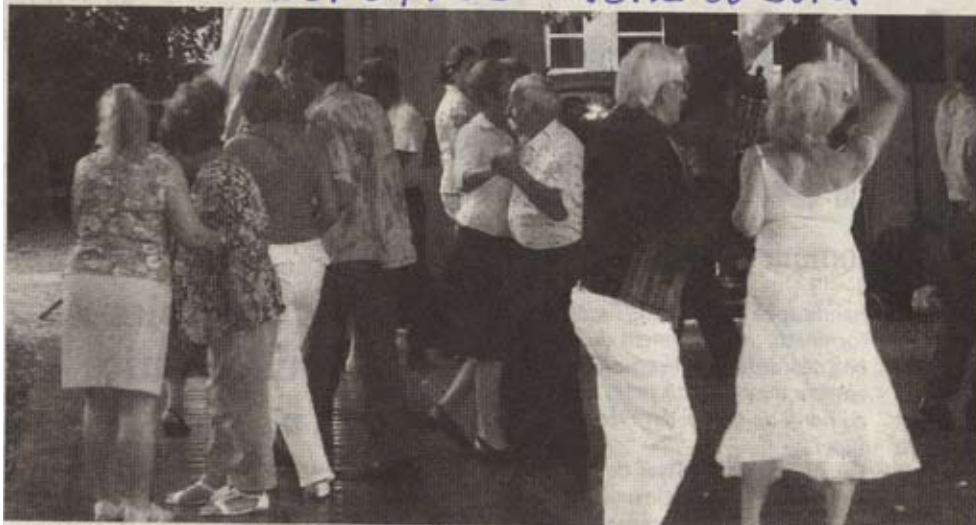
De juin à septembre, plus de 500 personnes fréquentent chaque année la guinguette (photo d'archives)

POUR SA réouverture prévue samedi 6 juin, la Guinguette du Parc des bains va légèrement bousculer les habitudes de ceux qui la fréquentent depuis sa création il y a six ans par l'association La Vir'Volte. Afin de remédier aux nuisances sonores dont se plaignaient l'an dernier certains habitants de la rue de Pavigny toute proche, la piste de danse va migrer quelques dizaines de mètres à l'est, de l'autre côté des terrains de pétanque, quasiment en plein centre du parc.