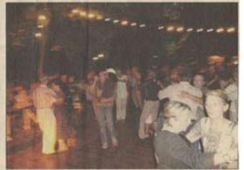
Musique, pétanque, danse, verre entre amis, voici quelques-uns des ingrédients de la guinguette

Même sur le terrain de boules, la guinguette a changé les habitudes. « Je réalise vraiment cette année à quel point l'ambiance est géniale et introuvable ailleurs » analyse Guillaume, un Lédonien de 28 ans.