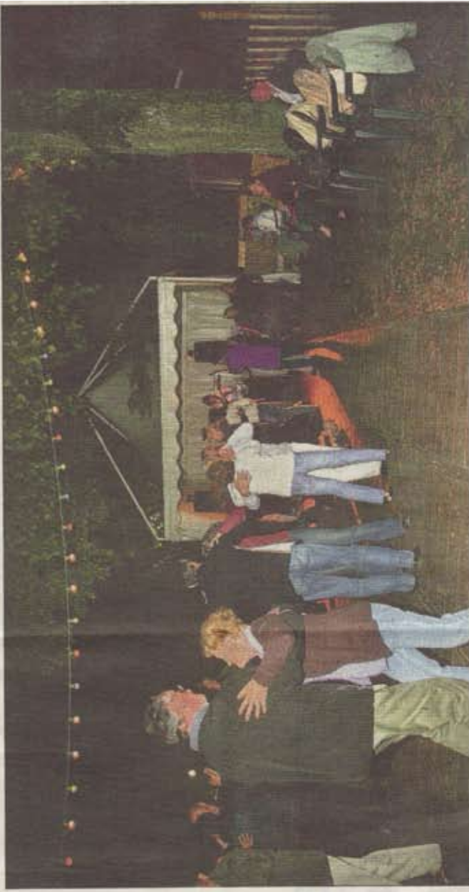
La guinguette, un lieu et bien plus que ça... Un endroit qui vit

Tranquillement, c'est une image ! Le programme de l'été s'annonce haut en couleurs avec 38 animations étalées sur les trois mois : 7 concerts (avec des têtes d'affiche comme